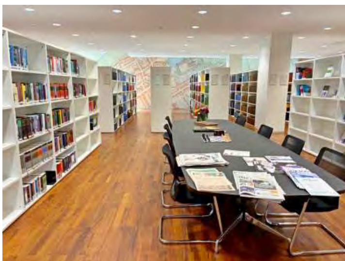
Slika 5: Čitalnica knjižnice Vrhovnega sodišča Nizozemske se razprostira kar čez dve nadstropji

Knjižnica zagotovo hrani več deset tisoč enot tiskanega gradiva in več kot tisoč antikvit, pomembnih za zgodovino nizozemskega pravosodja, čeprav nismo našli nobenega vira, ki bi potrdil, da je zbirka starih tiskov vrhovnega sodišča neposredno vključena v javno platformo digitalne knjižnice nizozemske nacionalne knjižnice Delpher (veliko skladišče digitaliziranih besedil KB) ali podoben sistem.