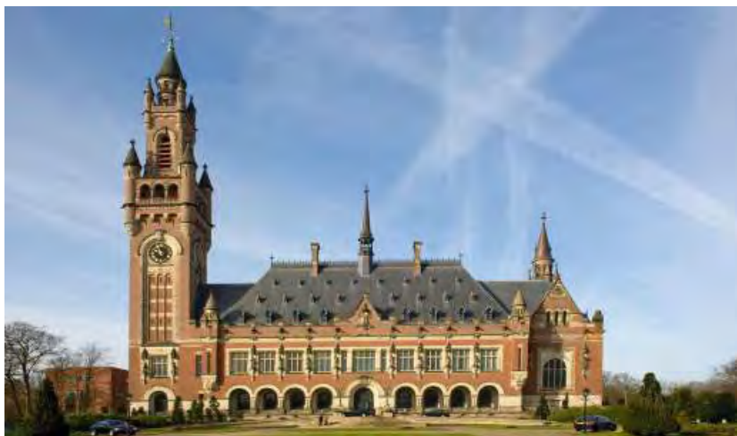
Slika 6: Stavba Meddržavnega sodišča v Haagu ( International Court of Justice ) iz leta 1913

V Palači miru, ki je verjetno ena najbolj ikoničnih stavb haaške pravne zgodovine, delujeta dve pravni knjižnici. Knjižnica Meddržavnega sodišča ( International Court of Justice ) in Mednarodna pravna knjižnica ( The International Law Library ). Prva je strogo namenjena notranji javnosti in je skoraj nedostopna za ogled, medtem ko je druga najpomembnejša haaška mednarodna pravna knjižnica, ki služi najširši javnosti.