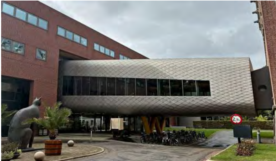
Slika 9: Moderna čitalnica, ki povezuje Meddržavno sodišče s Haaško akademijo za mednarodno pravo

Obisk haaških pravnih knjižnic je bil za nas zelo koristen, ker nam je pokazal, kakšni so trendi sodobnega pravnega knjižničarstva v eni najbolj razvitih evropskih držav. Primerjave neprimerljivih razmer so sicer zelo nehvaležne, kljub temu pa lahko spoznamo številne sodobne strokovne trende in tehnološke novosti, ki bodo še dolgo zaznamovali tudi naše delo v Ljubljani.