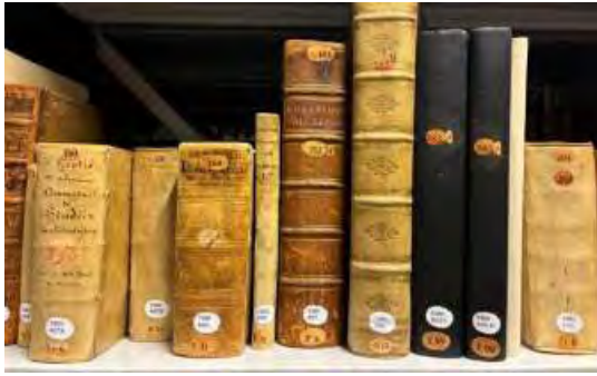
Slika 7: Posebna zbirka knjižnice – Grotiana

Klasifikacija pravne knjižnične zbirke izhaja še iz leta 1916, ko jo je sestavila Elsa Oppenheim, objavljena pa je bila še istega leta pod naslovom Catalogue de la bibliothèque du Palais de la paix . Knjižnica Palače miru svojim uporabnikom ponuja zbirko več tisoč e-knjig, skoraj 2.500 elektronskih revij, hkrati pa omogoča bralcem tudi dostop do več kot 60 baz elektronskih virov. Precej gradiv je bilo sprva dostopnih celo z oddaljenim dostopom, zaradi prevelikih zlorab pa je zadnje čase e-dostop vezan na lokacijo sodišča. Uporabniki morajo za celoletno uporabo knjižnice plačati 50 EUR članarine.