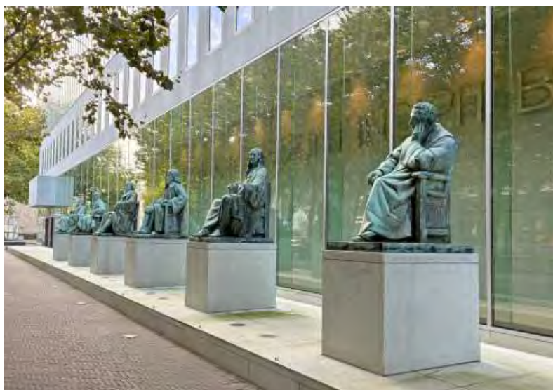
Slika 4: Pred novo stavbo vrhovnega sodišča je postavljena aleja s kipi najpomembnejših nizozemskih pravnikov

Knjižnica zagotovo hrani več deset tisoč enot tiskanega gradiva in več kot tisoč antikvit, pomembnih za zgodovino nizozemskega pravosodja, čeprav nismo našli nobenega vira, ki bi potrdil, da je zbirka starih tiskov vrhovnega sodišča neposredno vključena v javno platformo digitalne knjižnice nizozemske nacionalne knjižnice Delpher (veliko skladišče digitaliziranih besedil KB) ali podoben sistem.