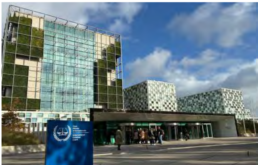
Slika 2: Mednarodno kazensko sodišče v Haagu

namensko zgrajene prostore preselilo 14. decembra 2015. Slovesna otvoritev je bila 19. aprila 2016, ko je prostore uradno odprl nizozemski kralj Willem-Alexander. Vodja knjižnice je bibliotekarka Irene Kraft Pagoaga, poleg nje pa so v knjižnici zaposleni še štiri bibliotekarji, ki poleg knjižnice skrbijo še za arhiv.