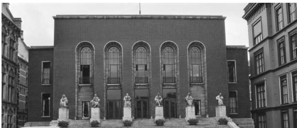
Slika 3: Stara stavba Vrhovnega sodišča Nizozemske, kjer je sodišče delovalo med leti 1864 in 1988

Knjižnica Vrhovnega sodišča Nizozemske je skozi zgodovino, tako kot vrhovno sodišče, menjala več lokacij, preden se je marca 2016 preselila v sedanjo novo stavbo na naslovu Korte Voorhout 8.